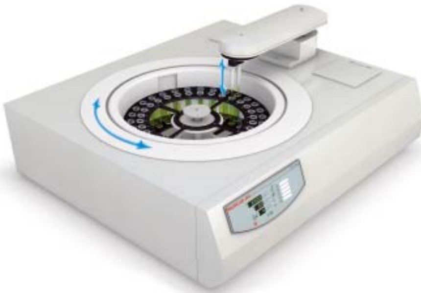
Zentrifugeneinheit in der Analysetechnik

einzelnen Achsen ausgestattet. Es gibt drei Achsen, auf denen sich der Pipettierroboter in allen drei Raumdimensionen bewegt. Die Überwachung der Motorsteuerung erfolgt in diesem Fall durch magnetische Absolutsensoren. Diese geben ein Positionsfeedback an die Steuereinheit zurück. Das Buchenbacher Unternehmen hat hier sehr flexibel auf die Kundenwünsche reagiert, da zwei Achsen bereits mit kundeneigenen Magnetsensoren bestückt wurden und Siko dazu nur die entsprechenden Magnetbänder mit einer Spezialcodierung geliefert hat. Die Längsachse wiederum verfügt über einen Siko-Sensor mit entsprechendem Magnetband. Dabei mussten auch die sehr engen Platzverhältnisse berücksichtigt werden. Angedacht war zunächst der Sensor MSA501, der jedoch von der Größe her nicht verbaut werden konnte.